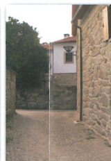
Aldeia dos Amiais