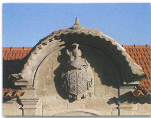
Brasão na Casa da Fonte em Couto de Baixo

Este percurso leva-nos a visitar duas das aldeias mais históricas da freguesia de Couto de Esteves. Na aldeia de Couto de Baixo, situada na zona onde o relevo é mais acidentado, destaca-se ao fundo do casarão a Casa da Fonte. Este solar erigido entre os séc. XVI e XVII, foi residência da ilustre família Sequeira e Quadros e aqui sobressai pela sua grandeza, e não menor nobreza, o brasão situado no topo da porta principal, e que confirma a importância da família neste território, que em tempos fez desta casa sua residência.