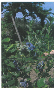
Campo de Mirtilos

O percurso desenvolve-se igualmente por caminhos que, no passado serviam de ligação entre as várias aldeias e a sede de freguesia (Vila de Couto de Cima), sendo na sua maior parte trilhados pelos percursos fúnebres e romarias de então. No decorrer deste percurso é também visível a grande ligação da população com a atividade agrícola, em especial no cultivo do milho e hortícolas e, mais recentemente, no cultivo dos pequenos frutos, em especial, o mirtilo, distribuídos pelos socalcos, talhados na vertente da serra.