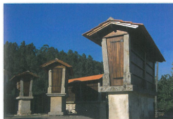
Canastos em Eira Comunitária na Aldeia dos Amiais

O percurso atravessa alguns bosques de pinheiros, eucaliptos, acácias, carvalhos e sobreiros, entrecortados por pequenas linhas de água que percorrem toda a encosta. Nestas linhas de água, é visível a existência de pequenas construções - moinhos de água - que outrora trabalhavam incessantemente na moagem dos cereais. Os espigueiros são também uma presença constante e inseparável deste processo do cultivo do milho, surgindo isolados ou agrupados, com eiras comunitárias, demonstrando deste modo, a vivência comunitária das suas gentes. O exemplo mais paradigmático é a Eira Comunitária da Aldeia dos Amiais, a qual exhibe sete canastos ou espigueiros, como habitualmente são designados.