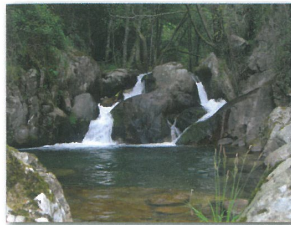
Vale do Rio Gresso