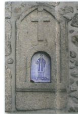
Alminhas de Santo Estevão em Couto de Cima

O percurso atravessa alguns bosques de pinheiros, eucaliptos, acácias, carvalhos e sobreiros, entrecortados por pequenas linhas de água que percorrem toda a encosta. Nestas linhas de água, é visível a existência de pequenas construções - moinhos de água - que outrora trabalhavam incessantemente na moagem dos cereais. Os espigueiros são também uma presença constante e inseparável deste processo do cultivo do milho, surgindo isolados ou agrupados, com eiras comunitárias, demonstrando deste modo, a vivência comunitária das suas gentes. O exemplo mais paradigmático é a Eira Comunitária da Aldeia dos Amiais, a qual exhibe sete canastos ou espigueiros, como habitualmente são designados.