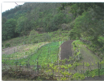
Terrenos cultivados em Catives

Este percurso é ainda marcado pelas paisagens de terrenos agrícolas que são cultivados nas aldeias de Catives e da Cerqueira, identificando a presença de uma prática agrícola de minifúndio que se mantém ainda nesta encosta da montanha, reforçada pela presença de alguns exemplares de canastros, símbolos da freguesia de Couto de Esteves e que se podem encontrar disseminados por este território.