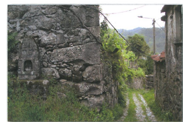
Aminhas e Caminho Tradicional em Catives

O percurso da Pedra Moura leva-nos também a conhecer o registo histórico/patrimonial mais antigo da freguesia de Couto de Esteves – a Anta da Cerqueira - monumento megalítico, testemunho da presença de pequenas comunidades humanas em Couto de Esteves, há cerca de 5000 anos atrás.