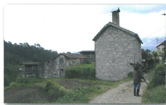
Aldeia de Catives