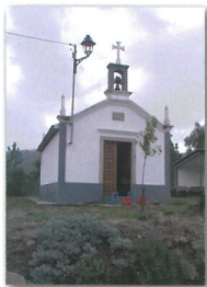
Capela da N. Sra. da Boa Viagem em Cerqueira

O percurso desenvolve-se por caminhos florestais, ao longo de levadas de regadio, nas margens do rio Gresso e por antigos caminhos pedonais de ligação entre as aldeias a Norte e a sede de freguesia de Couto de Esteves, passando pelos locais de culto das almas do purgatório – as alminhas, e por algumas capelas que podem ser visitadas, nomeadamente na aldeia de Catives (N. Sra. da Boa Hora) e na aldeia da Cerqueira (N. Sra. da Boa Viagem).